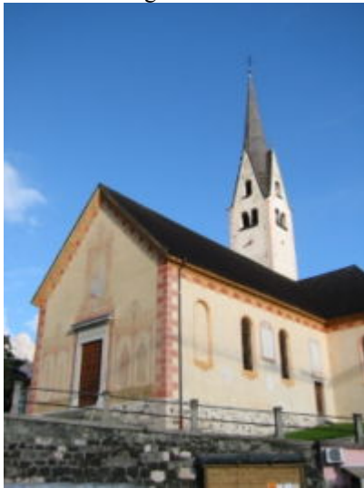
La chiesa di Fusine di Zoldo Alto

A Fusine l'edificio più importante è indubbiamente la chiesa, documentata per la prima volta nel 1570 e ricostruita nel 1909; all'esterno affrescata, custodisce un crocifisso ligneo di Andrea Brustolon . Poco fuori l'abitato, è possibile raggiungere i resti di una delle tantissime fucine che testimoniavano l'attività fabbrile tipica dello Zoldano.